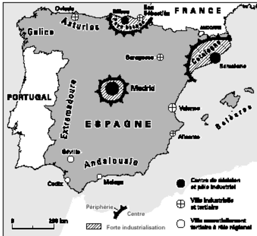
Figure 3 Les 3 moteurs économiques de l'Espagne (d'après Reynaud, 1981)

Même si la construction de l'état-nation espagnol et l'hégémonie politique, militaire et linguistique de la Castille semblaient aller de pair depuis les premiers succès de la Reconquista au Moyen Age, les régimes monarchiques n'ont jamais pu éliminer les communautés non-castillanophones (Mar-Molinero, 1997 : 6). Certes, des mesures indiquant une politique linguistique centralisatrice sont loin d'être inexistantes ; on peut citer, par exemple, la création de la Real Academia de